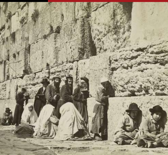
Western Wall - Jerusalem

Israel es un producto de la culpa europea por el Holocausto nazi. ¿Por qué deberían pagar ese precio los palestinos?