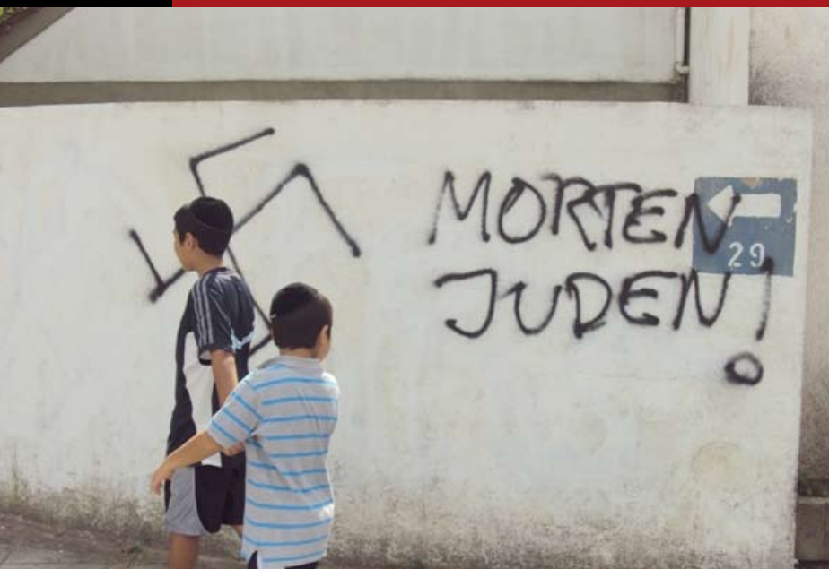
“Death to Jews!” - Argentina

Las políticas Israelíes son la causa del antisemitismo en el mundo.