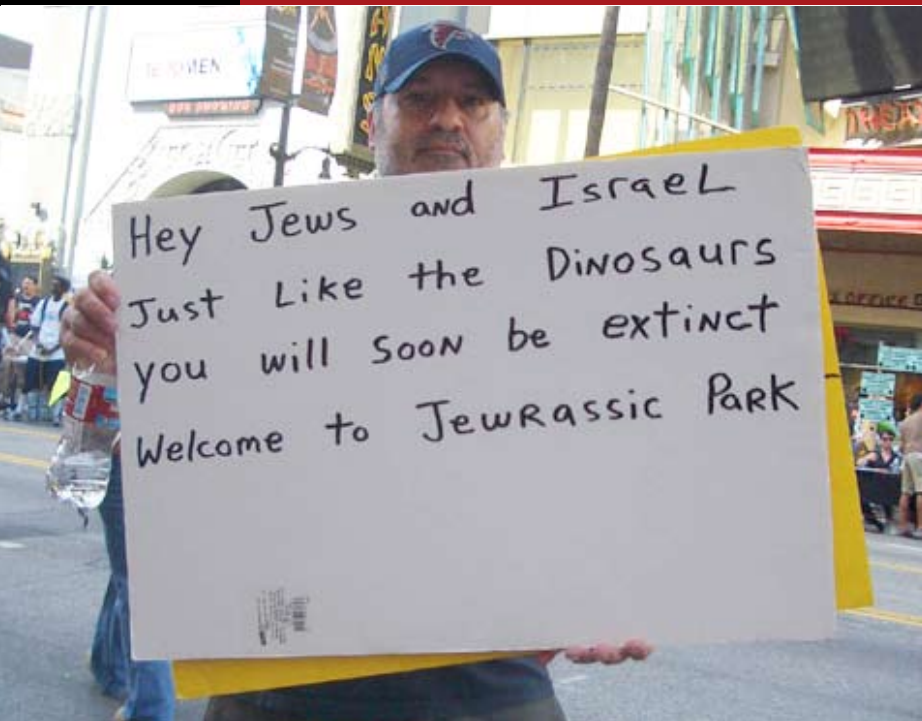
Anti-Israel rally - Los Angeles

La única esperanza de paz es un único estado binacional, eliminando el Estado judío de Israel.