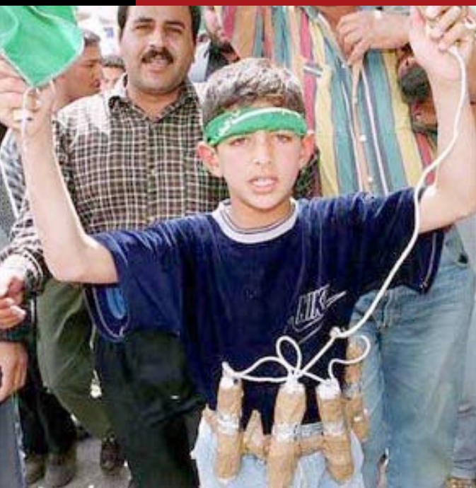
Glorifying Terrorism - Gaza City

Israel es el principal escollo para lograr una solución de "dos Estados"