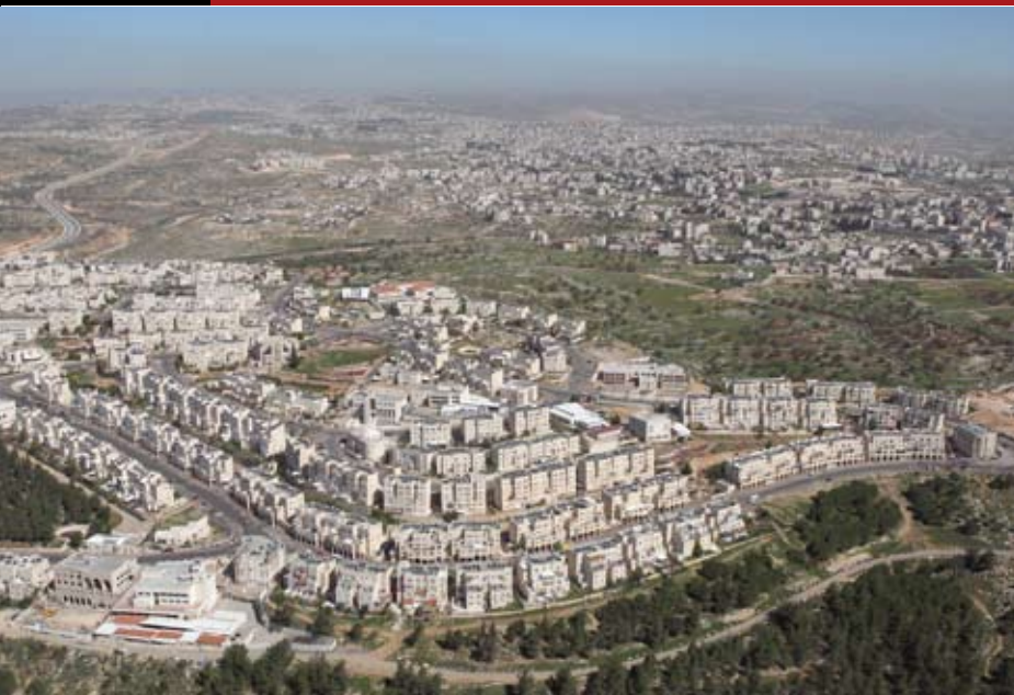
Ramat Shlomo, Israel

Los planes para construir 1.600 hogares más en Jerusalem oriental demuestran que Israel está "judaizando" la Ciudad Santa.