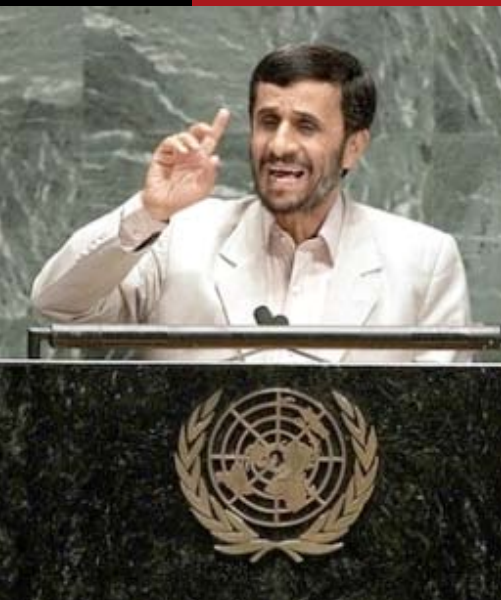
Ahmadinejad at UN

La mayor amenaza para la paz y la estabilidad no es Irán sino un Israel nuclear.